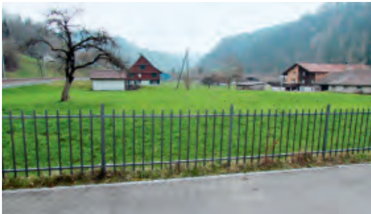
Wiese neue Zufahrt